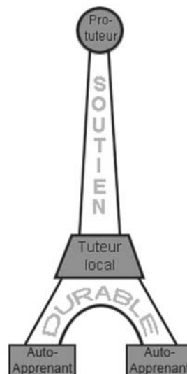
SOUTIEN DURABLE à Liserons - le soutien scolaire

Gérard Claes, 15 rue de Wattignies, 75012 Paris.