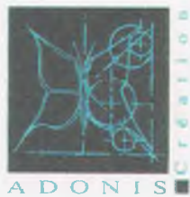
Enregistrement N° 1 713 303