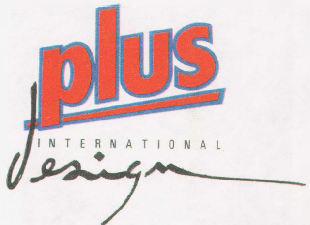
Enregistrement N° 1 713 369