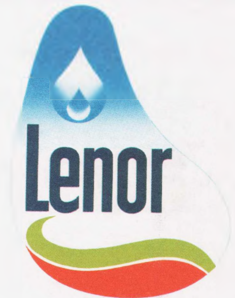
Enregistrement N° 1 713 385