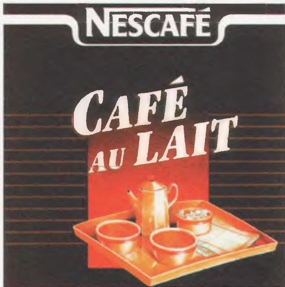
Enregistrement N° 1 713 295