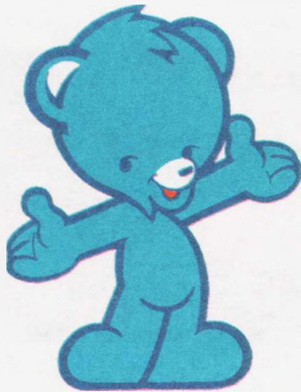
Enregistrement N° 1 713 294