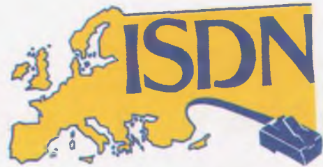
Enregistrement N° 1 713 313