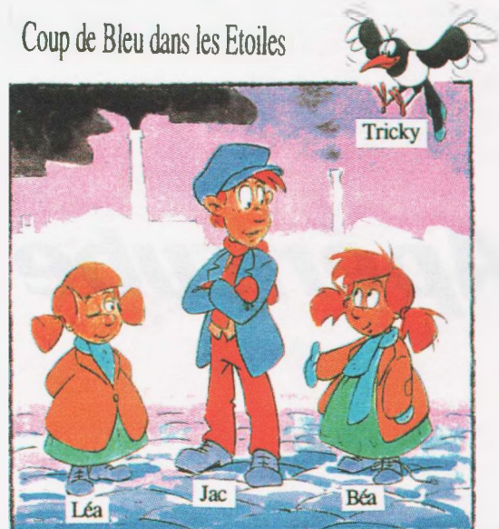
Enregistrement N° 1 711 770