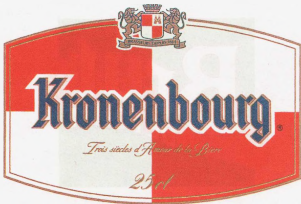
Enregistrement N° 1 711 709