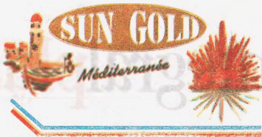
Enregistrement N° 1 711 731