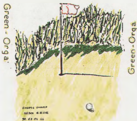
Enregistrement N° 1 676 827

Green - Orga L'Engrais des Professionnels