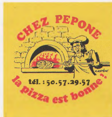
Enregistrement N° 1 676 830

Green - Orga L'Engrais des Professionnels