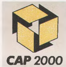
Enregistrement N° 1 676 806