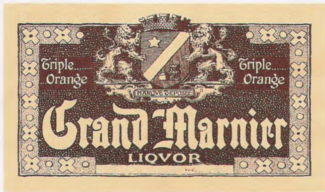
Enregistrement N° 1 676 818