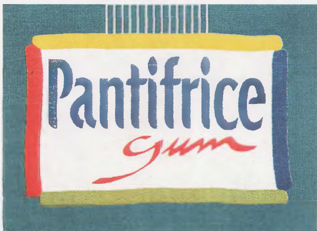
Enregistrement N° 1 667 426