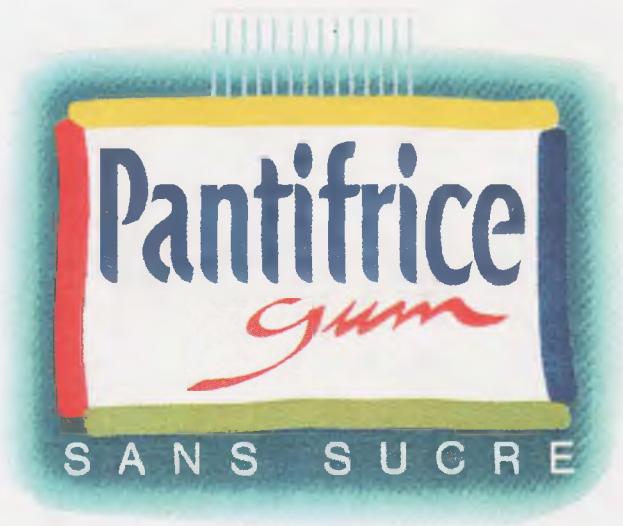
Enregistrement N° 1 667 425