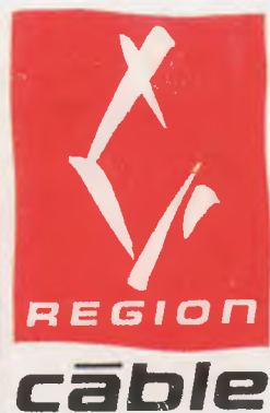
Enregistrement N° 1 667 458