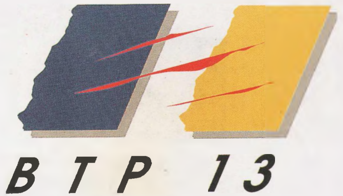
Enregistrement N° 1 667 514