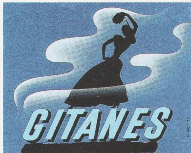
Enregistrement N° 1 660 654