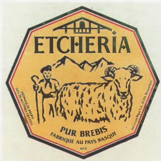
Enregistrement N° 1 660 625