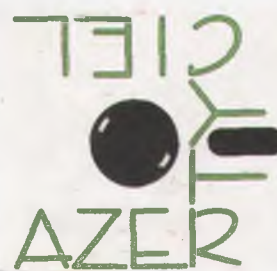
Enregistrement N° 1 660 676