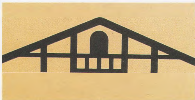
Enregistrement N° 1 660 627