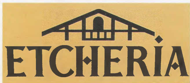
Enregistrement N° 1 660 626