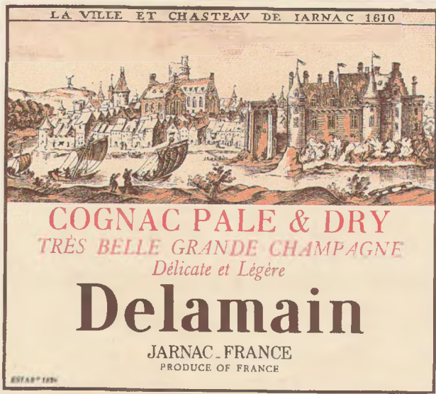
Enregistrement N° 1 660 126