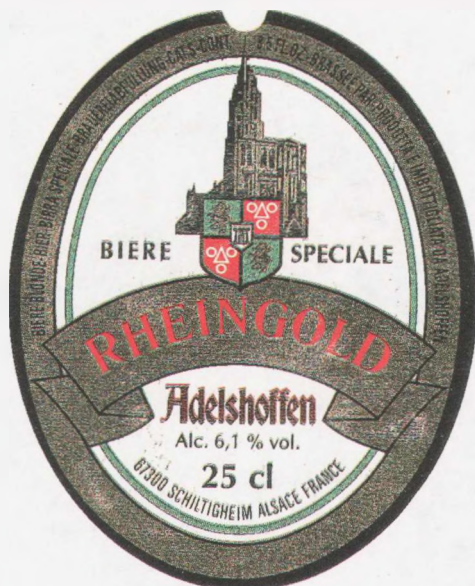
Enregistrement N° 1 660 140