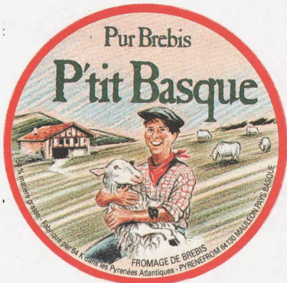
Enregistrement N° 1 660 133