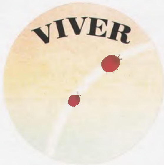
Enregistrement N° 1 647 500