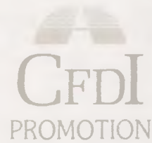
Enregistrement N° 1 647 510