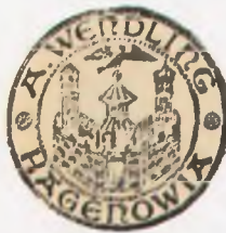
Enregistrement N° 1 647 501