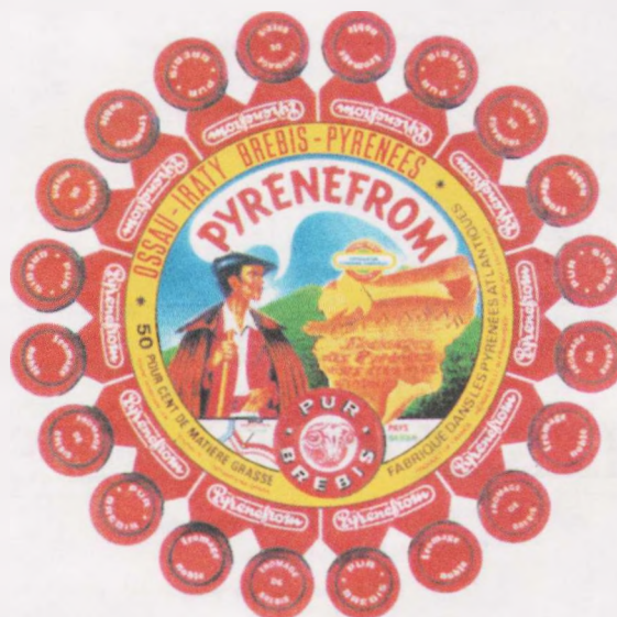
Enregistrement N° 1 613 684