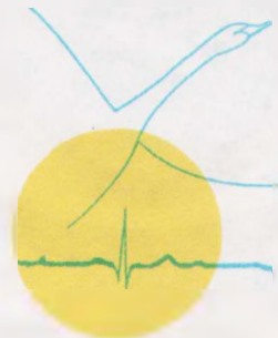
Enregistrement N° 1 613 679